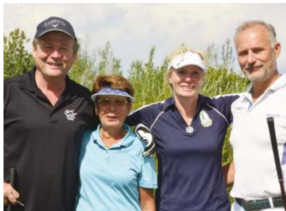
• Gute Stimmung im Flight

Da werden wir uns wohl etwas besonderes einfallen lassen.