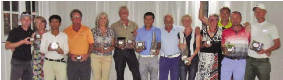
• Die Sieger der 36 Loch von Pankow mit dem Präsidenten