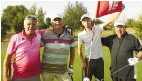
• Der beste Netto-Flight (zusammen 345 Nettopunkte)