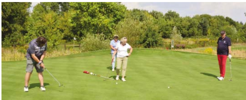
• Geht er rein?