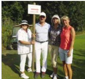
• Abschlag 26 (= Tee 14 Sepp Maier Platz)