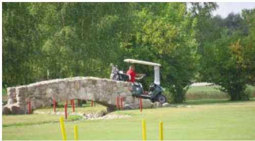
● Fahrt über die Hentschel-Bridge