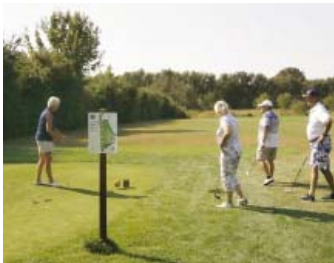
• Abschlag am Tee 3 (Übungsplatz)