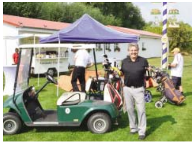
● Imbiss am Maibaum