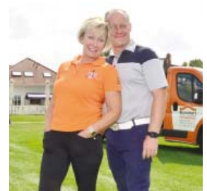
● Das Organisations-Team