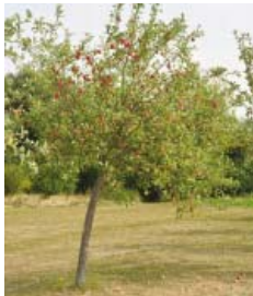
● Noch ein Imbiss auf der Runde