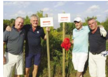
• Am Weg vom Kurzplatz zum Sepp Maier Platz