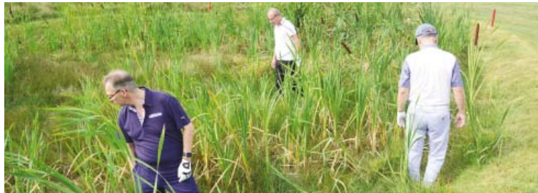
● Was suchen die?