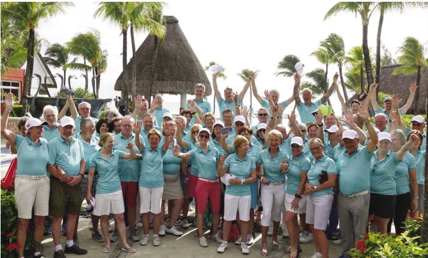
• Die Teilnehmer der Sepp Maier Golf Trophy 2018 im Ambre Resort auf Mauritius