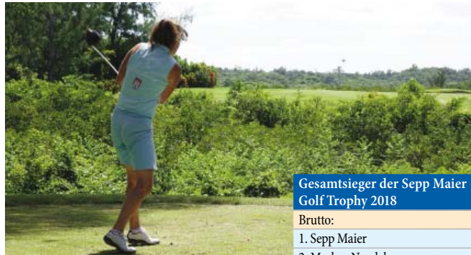
• Nicht alle Bälle trafen das Fairway