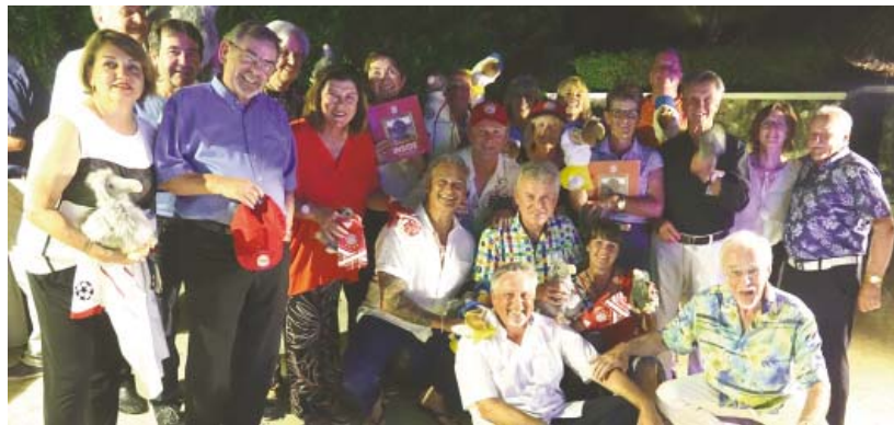
• Die Sieger beim Abschiedsabend am Strand von Belle Mare