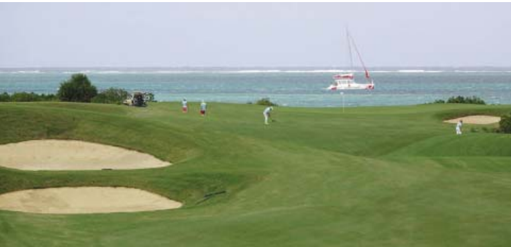
• Am Anahita Golf Course