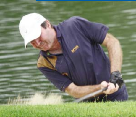
• Kein leichter Schlag