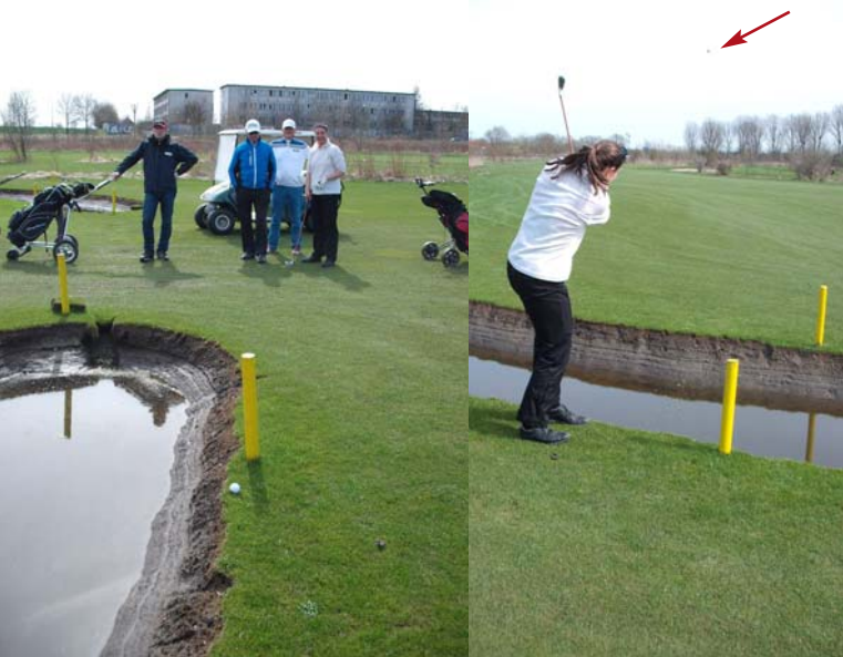
● Schwierige Lage auf Bahn 24