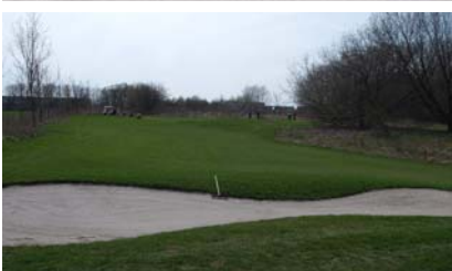
● Blick auf Grün 29