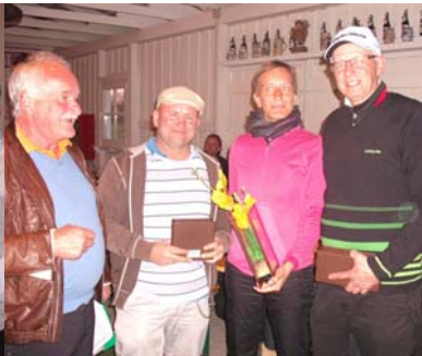
● Sieger der Sonderwertungen