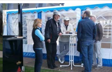
● Nach der Runde