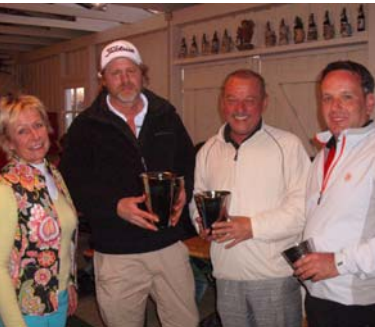
● Nettosieger Klasse B