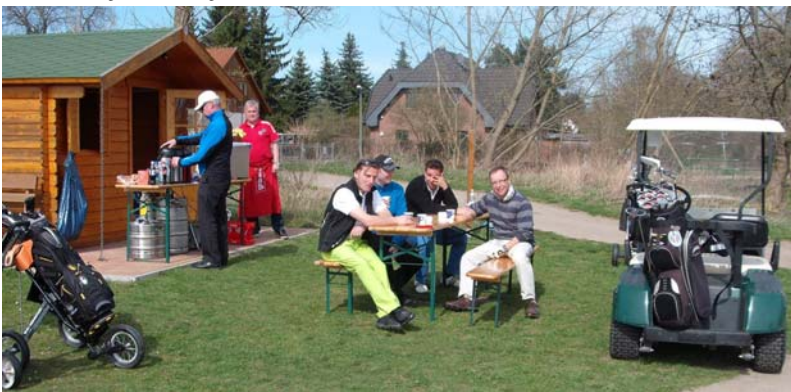
● Imbiss nach 25 gespielten Bahnen