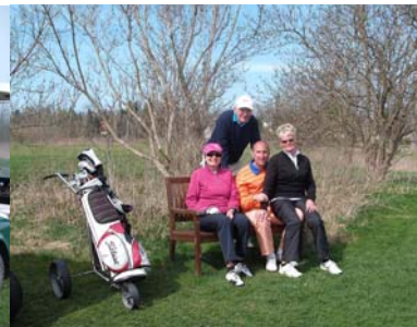
● Kleine Pause am Tee 22