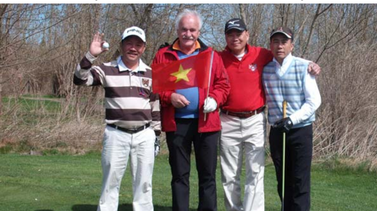
● Der Vietnam-Flight mit Präsident Rüdiger Umhau