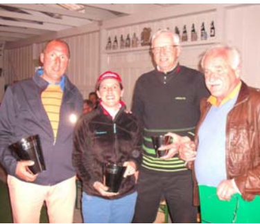
● Nettosieger Klasse A