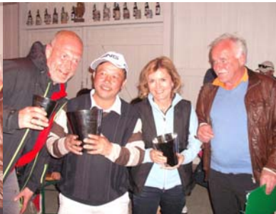
● Nettosieger Klasse D