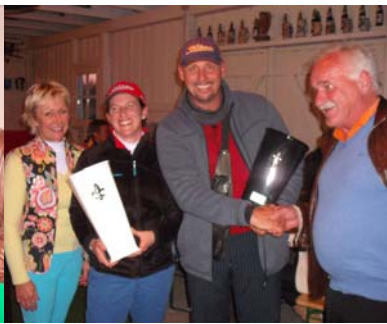
● Die Bruttosieger