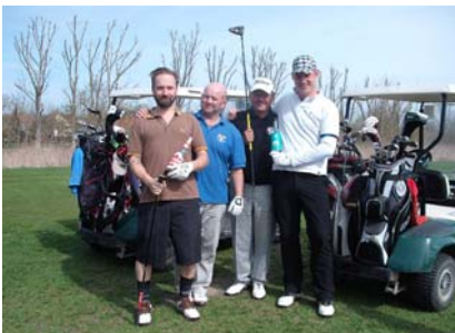
● Die Stimmung war hervorragend