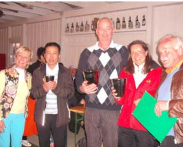
● Nettosieger Klasse C