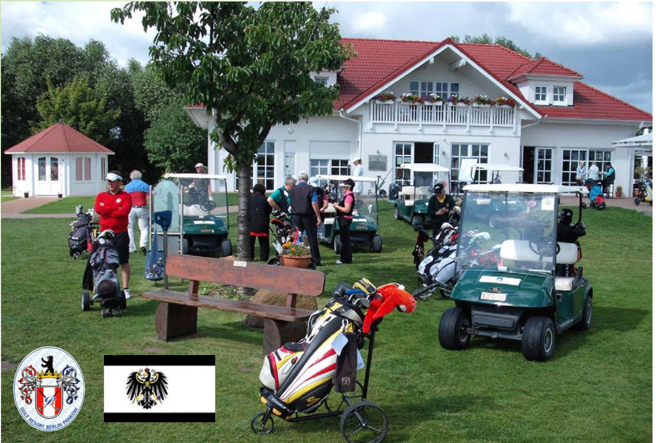
● Start am Sepp Maier Platz