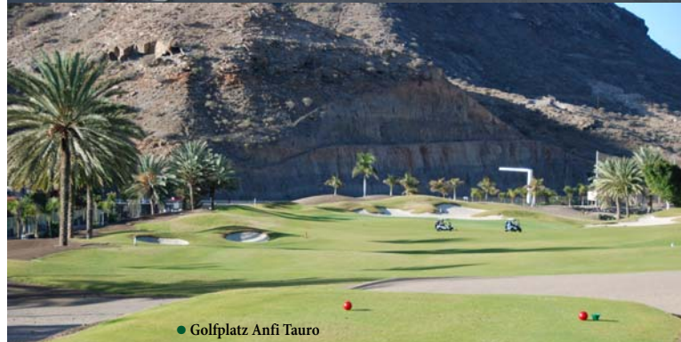
Golfplatz Anfi Tauro