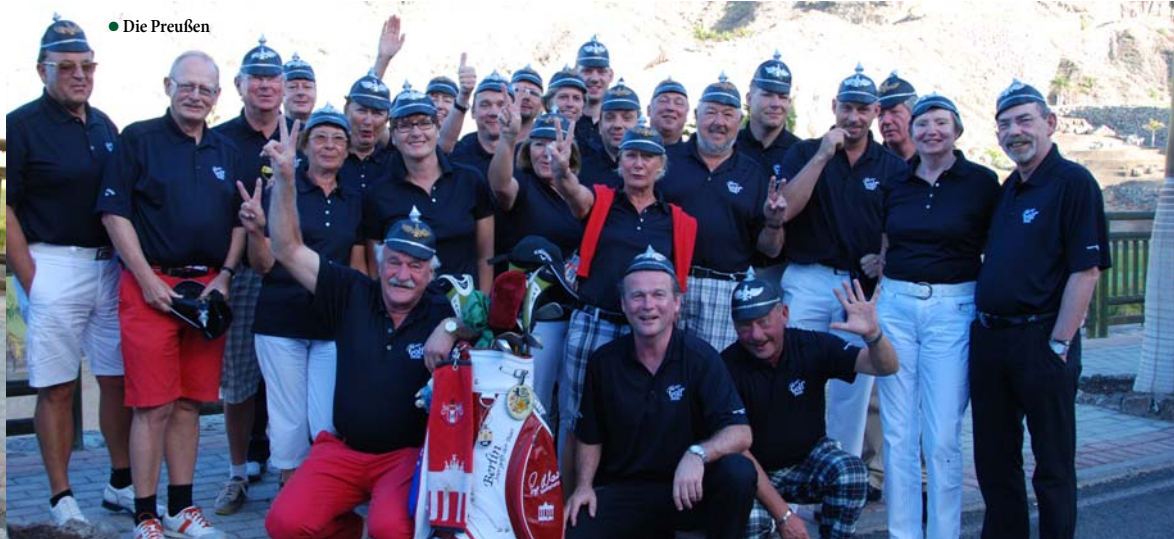
● Die Preußen