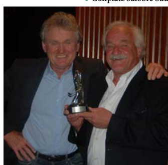
● Die Pokalübergabe