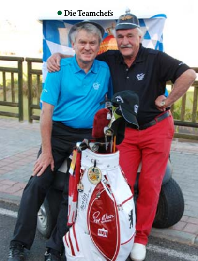
● Die Teamchefs