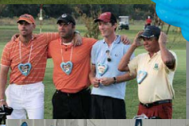
▶ Die Siegerpreise