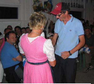
▶ Der Open Champion von Pankow