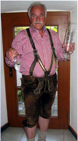
▶ Der bayerische Präsident bei der Siegerehrung