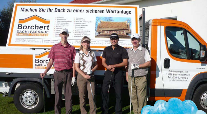
▶ Der Sponsor der Teegeschenke