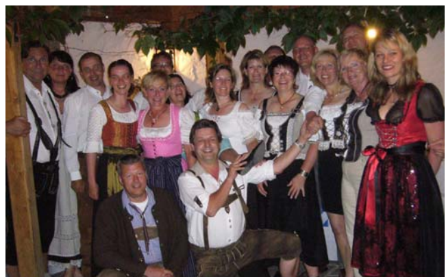
► Team Pankow von Berlin