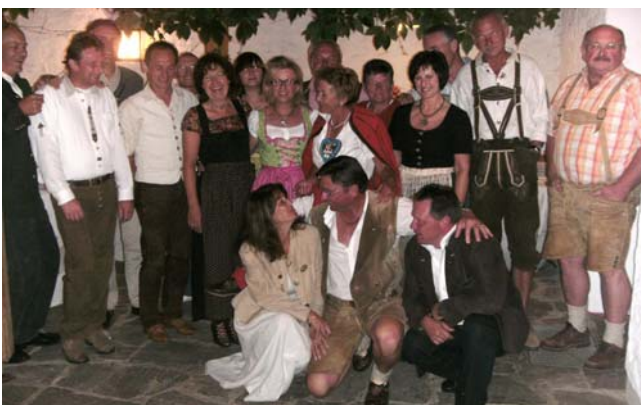
► Team Anthal-Waginger See

Selbstverständlich ist eine Revanche des Vergleichskampfes in Berlin geplant, auch eine Wiederholung der „Bayerischen Turniertage“ in Anthal wurde für das Jahr 2010 gewünscht.