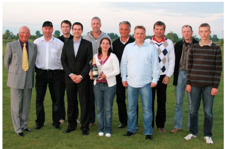
Die Sieger mit den Sponsoren