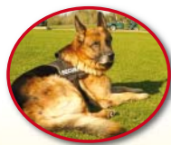
Balou Wachhund (November 2004 bis Juli 2016)