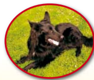
Bruno Wachhund (seit Oktober 2011)