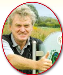
Sepp Maier Gründungsmitglied/Schirmherr